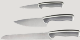
CUCHILLOS 1 u. Cuchillo para pan 1 u. Cuchillo Grande 1 u. Cuchillo Pequeño