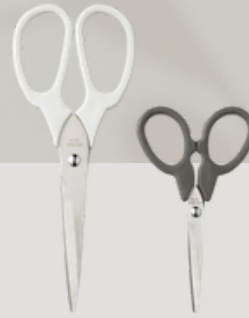
TIJERAS 1 u. Tijera Grande 1 u. Tijera Pequeña