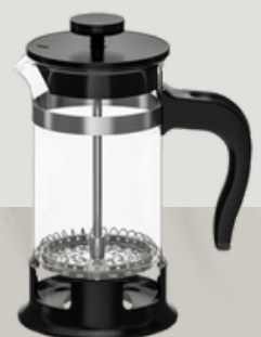
CAFETERA / TETERA Cafetera/Tetera a presión