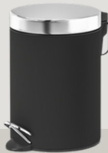
ZAFACÓN 4 Galones