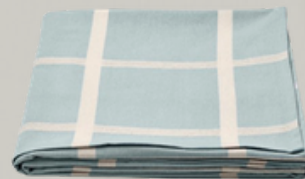
MANTEL Mantel de 57x94 cm.