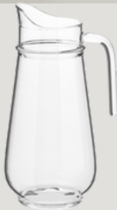
JARRA Jarra de 1.7L.