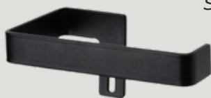
SOPORTE Soporte Papel Higiénico