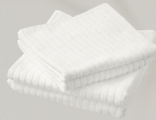
TOALLAS 2 u. Toallas pequeñas 2 u. Toallas de pies 2 u. Toalla de mano 2 u. Toalla de Ducha