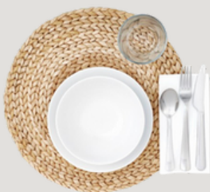
TAPETE 4 u. Tapetes individuales